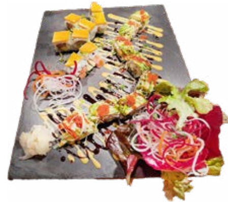
Menü 208: 23,00€ 8 Mango Roll, 8 Mario Dragon Roll