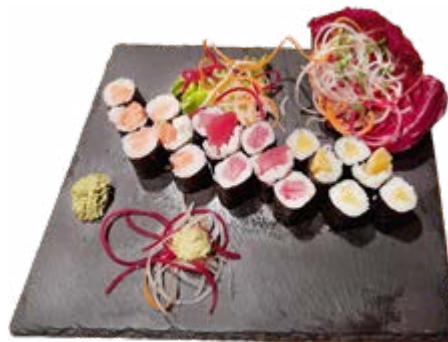
Menü 210: 17,50€ 18 Maki: 6 Lachs, 6 Thunfisch, 6 Rettich