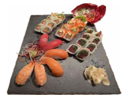
Menü 206: 34,00€ 8 Samurai Roll, 8 Vokano Roll, 8 Red Roll, 6 Nigiri: 2 Lachs, 2 Ebi, 2 Thunfisch