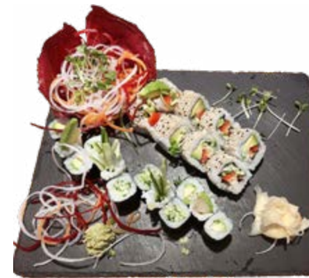
Menu 201: 17,50€ 6 Avocado, 6 Gurken, 8 vegetarische

Zu jedem Sushi Gericht gibt es, eingelegten Ingwer 3,11 (Gari), grünen Meerrettich 1,3,12,13 (Wasabi) und Sojasauce 4,f . Selbstverständlich werden dazu japanische Holzstäbchen beigelegt