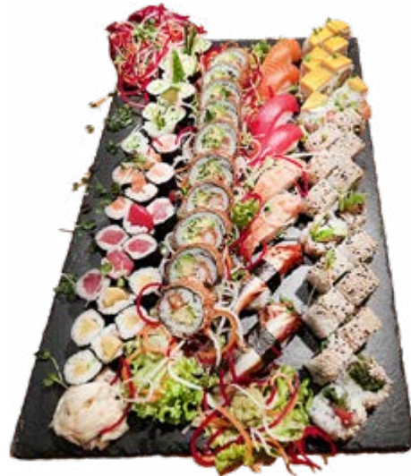
Menü 220: 90,00€

6 Maki: 3 Lachs, 3 Thunfisch, 8 Mario Tomono Roll, 3 Nigiri: 1 Lachs, 1 Thunfisch, 1 Ebi