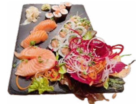
Menü 204: 22,00€ 6 Lachs Maki, 8 vokano Roll, 2 Nigiri Lachs, 2 klein Lachs Sashimi