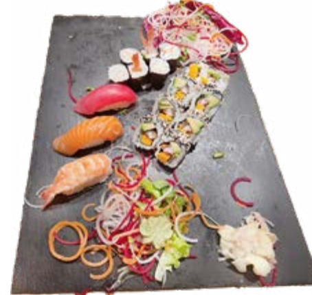
Menü 217: 23,00€ 6 Ebi Maki, 8 Unagi Roll, 3 Nigiri: 1 Lachs, 1 Thunfisch, 1 Ebi