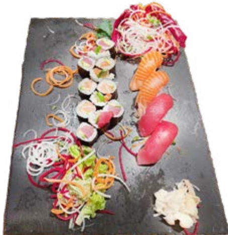
Menü 215: 22,00€ 12 Maki: 6 Lachs Avocado, 6 Thunfisch Avocado, 4 Nigiri: 2 Lachs, 2 Thunfisch