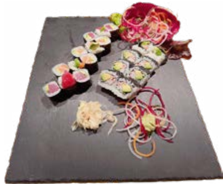
Menü 207: 20,00€ 12 Maki: 6 Lachs Avocado, 6 Thunfisch Avocado, 8 california Roll mit Sesam

Montag bis Freitag vom 11.30 bis 14.30 Uhr 15% Rabatt auf Mittags-Sushi Menü