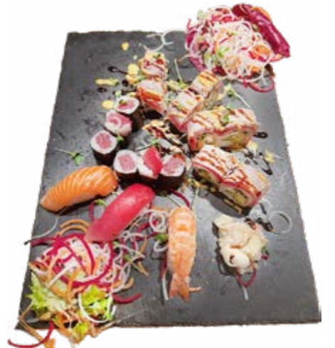
Menü 218: 30,00€ 6 Thunfisch Maki, 8 Mario Super Roll, 3 Nigiri: 1 Lachs, 1 Thunfisch, 1 Ebi