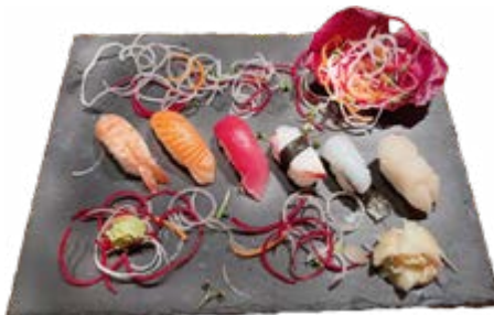
Menü 211: 16,00€ 6 Nigiri: 1 Lachs, 1 Thunfisch, 1 Ebi, 1 Tintenfisch 1 Oktopus, 1 Jacobmuscheln