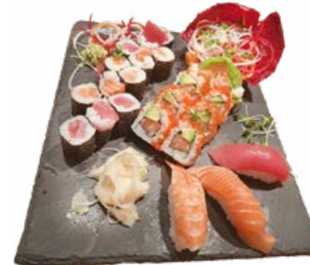
Menü 203: 25,00€ 3 Nigiri: 1 Lachs, 1 Thunfisch, 1 Ebi 12 Maki: 6 Lachs, 6 Thunfisch, 8 Samurai Roll