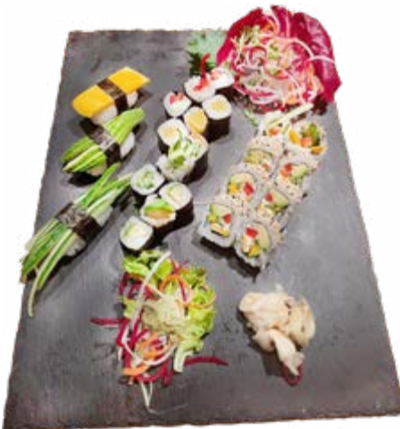
Menü 212: 20,00€ 3 Paprika, 3 Rettich, 3 Avocado, 3 Gurke, 8 Gemüse Philadelphia, 3 Nigiri: 1 Mango, 1 Avocado, 1 Gurke