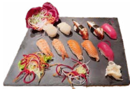
Menü 209: 28,00€ 8 Nigiri: 2 Lachs, 2 Thunfisch, 2 Ebi, 2 Unagi, 2 Jacobmuscheln