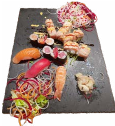
Menü 219: 28,00€

Montag bis Freitag vom 11.30 bis 14.30 Uhr 15% Rabatt auf Mittags-Sushi Menü