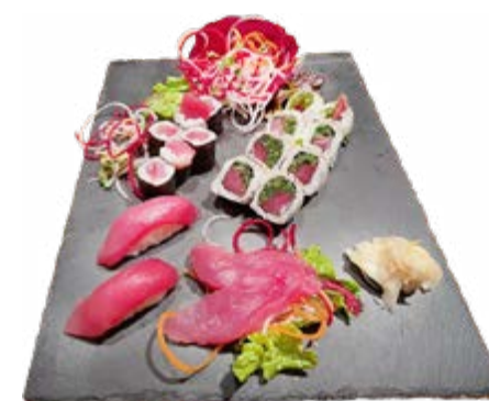
Menü 205: 26,00€ 6 Thunfisch Maki, 8 Red Roll, 2 Thunfisch Nigiri, 2 klein Thunfisch Sashimi