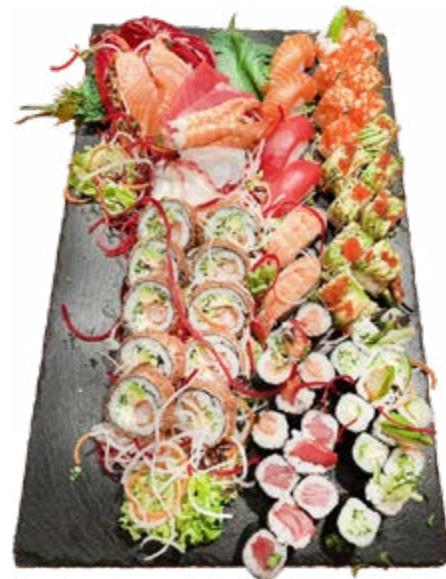
Menü 222: 90,00€

30 Maki: 6 Avocado, 6 Gurke, 6 Rettich, 6 Thunfisch, 6 Lachs, 32 Roll: 8 Samurai, 8 Vokano, 8 Mario Dragon, 8 Golden Crunchy, 10 Ni- giri: 2 Lachs, 2 Thunfisch, 2 Ebi, 2 Unagi, 2 Avocado und Sashimi Mix