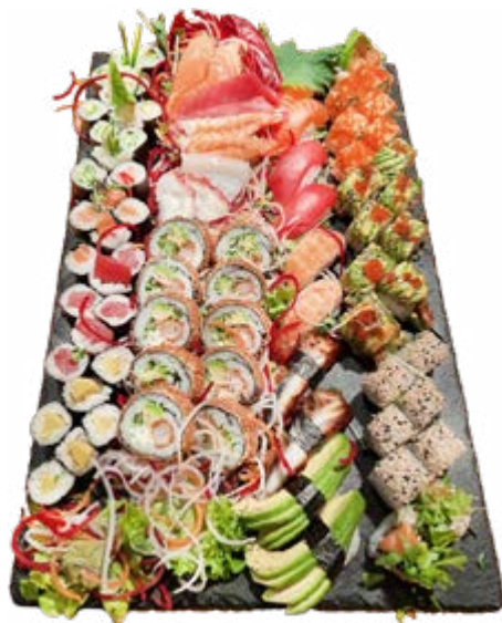
Menü 221: 123,00€

6 Maki: 1 Avocado, 1 Gurke, 1 Rettich, 1 Lachs, 1 Thunfisch, 32 Roll: 8 Vokano, 8 Red, 8 Mango, 8 Golden Crunchy, 8 Nigiri: 2 Lachs, 2 Thunfisch, 2 Ebi, 2 Unagi