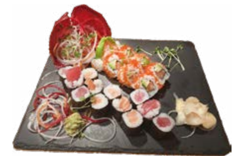
Menü 202: 21,00€ 12 Maki: 6 Lachs, 6 Thunfisch, 8 Samurai Outside