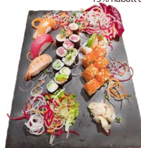
Menü 213: 25,00€ 12 Maki: 3 Lachs, 3 Thunfisch, 3 Avocado, 3 Gurken, 8 Samurai Roll, 3 Nigiri: 1 Lachs, 1 Thunfisch, 1 Ebi

Montag bis Freitag vom 11.30 bis 14.30 Uhr 15% Rabatt auf Mittags-Sushi Menü