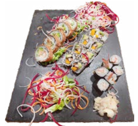
Menü 216: 24,00€ 6 Ebi Maki, 8 Unagi Roll, 5 Hero Crunchy Roll